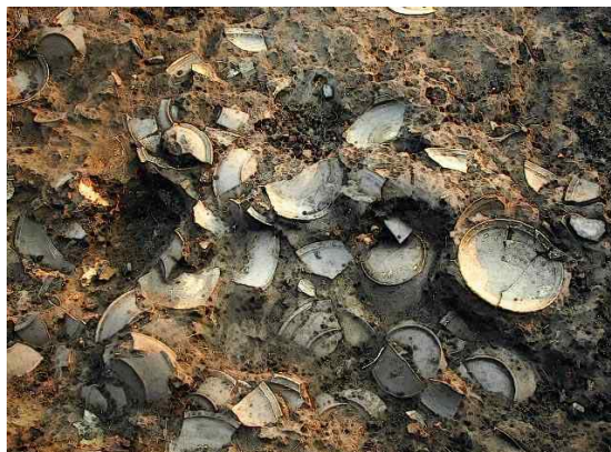
<그림 2> 가마터 발굴현장

등으로 구분하여 불리고 있다. 이러한 도요지는 각각 다른 모양을 하고 있는데 대개 두 가지 형태로 지어져 있다. 그 첫 번째가 경사면에 땅을 굴처럼 파서 만든 형태로 주변을 독을 쌓듯 높게 세워 가마터로 사용하였고, 두 번째로는 벽돌을 사용하지 않고 대나무로 둥글게 지붕모양을 만들어 진흙으로 덮은 형태인데 이러한 가마터는 보통 4.8미터×2미터의 작은 가마터에서 나타난다.