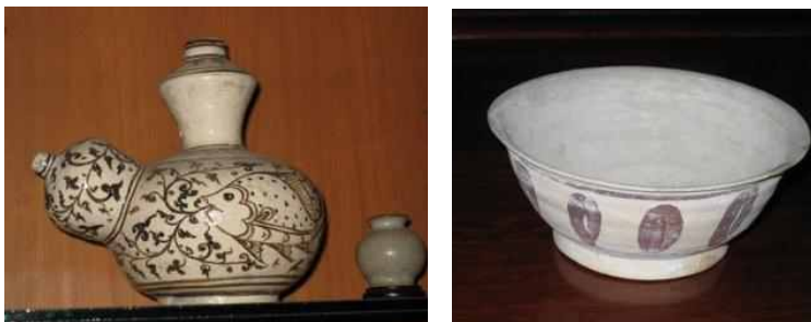
<그림 6> 위양까롱출토 도자기 @Khun Lek

위양까롱 지역은 도자기를 만들기에 가장 적합한 지역으로 평가받고 있다. 그 가장 큰 이유가 이 지역의 태토에 있다. 태국 전역에서 이 지역에서만 생산되는 고품토와 흡사한 질을 가진 백토로 점성과 입자가 좋아 가볍고 단단한 재질을 자랑한다. 또한 1300도의 고온에서도 잘 견디어서 그 순도가 아주 높은 아름다운 색감의 도자기를 만들 수 있었다. 이 지역에서 출토된 도자기를 열루미네스스 연대측정법으로 추정해 보면 약 13세기부터 제조를 했던 것으로 보인다. 위양까롱의 도자기는 대체로 다음과 같은 과정을 거쳐 만들어진 것으로 보인다.