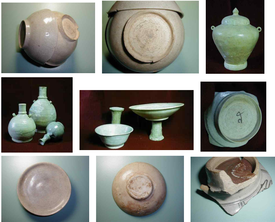
<그림 5> 위양까롱출토 도자기 @LTT.CRU