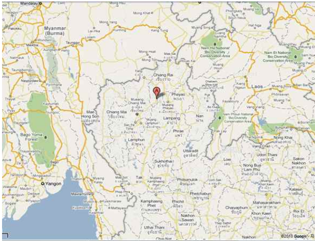
<그림 4> 위양까롱 위치

위양까롱은 란나의 주요도시 4) 를 관통하는 곳에 세워져 있다. 그러나 도요지는 그 주변의 산악지대를 따라 만들어져 있었고 주변으로는 강줄기가 나 있었기 때문에 버마나 아유타야와 같이 주변의 강성한 외부 세력으로부터 도요지를 비교적 안전하게 지킬 수 있는 지리적인 이점이 있었다. 따라서 위양까롱의 독자적인 도자기문화는 오늘날까지 이 지역인들에 의해 태국의 대표적인 도요지로서 그 이름을 알리고 있으며 특히 란나문화의 계승자로서의 역할도 담당하고 있다.