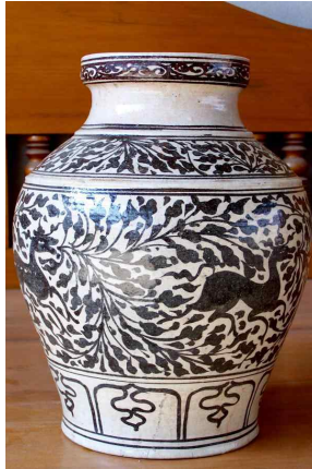
<그림 1> 위양까롱 출토 도자기 @Moohin

프라버리한텡타니 승려가 저술한 태국연대기와 불기 25세기를 기념하여 짱왓 2) 치양라이에서 발간한 치양라이 역사서에 따르면 위양까롱은 이미 기원전 1세기 경에 세워진 도시로 2000년 이상된 고도라고 믿어진다. 1933년 짱왓 우프라딕의 6대 도지사인 프라야나컨프라람에 의해 발굴되기 시작한 위양까롱 도요지는 짱왓 치양라이 암퍼 3) 위양빠오에 소재하고 있다. 특별히 200여기의 가마터가 라우강변을 따라 일렬로 늘어선 형태로 발견이 되었으며 위양까롱 전역에 널리 퍼져 있는 가마터는 아직 발굴되지 않은 것까지 포함하여 1000기가 넘는다 하니 가히 태국을 대표하는 도요지라 할만하다. 이러한 가마터는 위양까롱을 중심으로 서쪽은 빠싼 도요지, 동쪽으로는 빠헤우 도요지, 빠움 도요지, 빠동싼꾸 도요지, 후워이파오 도요지 그리고 후워이싸이 도요지