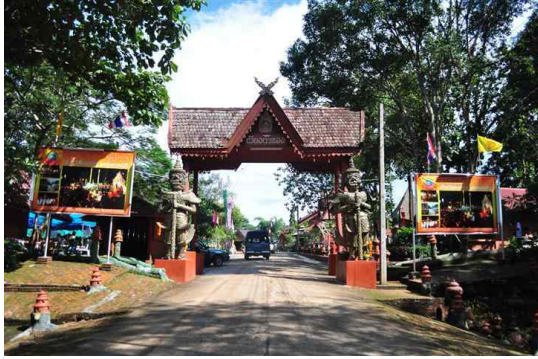
<그림 3> 위양까롱민속마을 입구

위양까롱은 란나의 주요도시 4) 를 관통하는 곳에 세워져 있다. 그러나 도요지는 그 주변의 산악지대를 따라 만들어져 있었고 주변으로는 강줄기가 나 있었기 때문에 버마나 아유타야와 같이 주변의 강성한 외부 세력으로부터 도요지를 비교적 안전하게 지킬 수 있는 지리적인 이점이 있었다. 따라서 위양까롱의 독자적인 도자기문화는 오늘날까지 이 지역인들에 의해 태국의 대표적인 도요지로서 그 이름을 알리고 있으며 특히 란나문화의 계승자로서의 역할도 담당하고 있다.